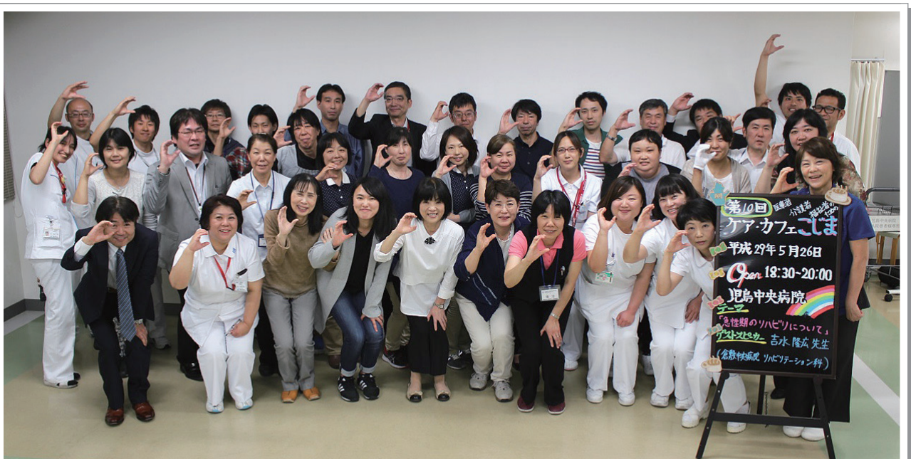
▲第10回ケアカフェこじま 参加者全員で恒例の記念撮影