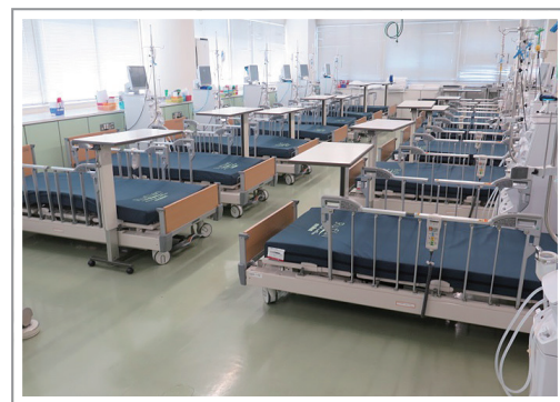
▲4月にベッドを入れ替えた当病院の透析センター