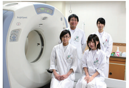
▲安全・安心な検査を心がけています

今回はエックス線 CT 装置についてお話をさせていただきます。みなさんは CT 検査を受けたことがありますか?ご本人でなくとも、身の周りに検査を受けた事のある方がいらっしゃると思います。それほどよく知られた検査であり必要な検査であるということですね。