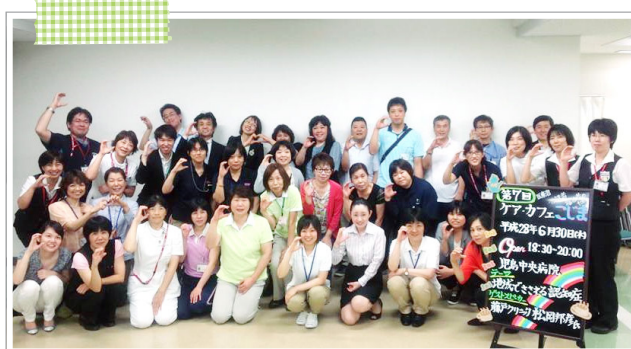
▲第7回ケアカフェこじま 参加者全員で恒例の記念撮影